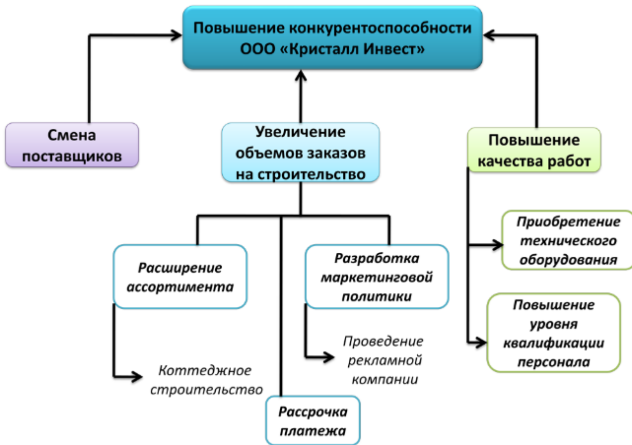
Рисунок 4 - Предлагаемые мероприятия по повышению конкурентоспособности ООО «Кристалл Инвест»