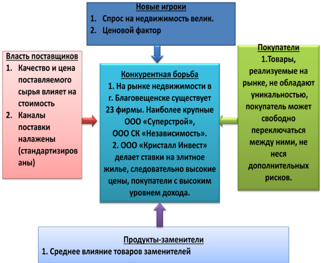
Рисунок 3 - Модель конкуренции пяти сил М. Портера для ООО «Кристалл Инвест»

На основе выявленных возможностей и угроз построен SWOT-анализ (таблица 8).